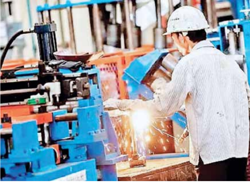
युवा सहकार टीम

रोजगारपरक सात मैनुफैक्चरिंग क्षेत्रों सेमीकंडक्टर, बायोफार्मा, इलेक्ट्रॉनिक्स कंपोनेंट्स, रेयर अर्थ, केमिकल, कैपिटल गुड्स और टेक्सटाइल को बढ़ावा देने की घोषणा